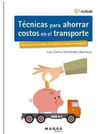
Técnicas para ahorrar costos en el transporte. Aurum 2E