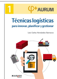
Técnicas logísticas para innovar, planificar y gestionar. Aurum 1