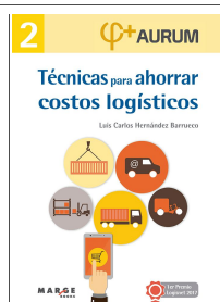
Técnicas para ahorrar costos logísticos. Aurum 2