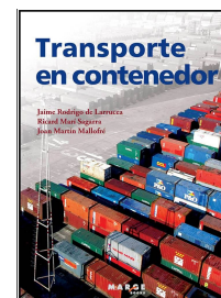
Transporte en contenedor