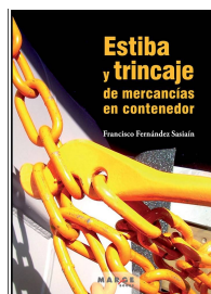
Estiba y trincaje de mercancías en contenedor