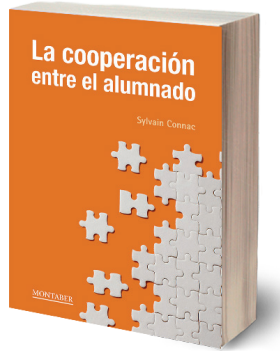
Figure 1. Couverture du livre La cooperación entre el alumnado .