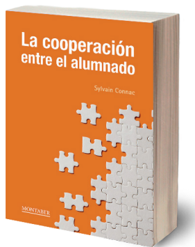
Figura 1. Coberta del llibre La cooperación entre el alumnado .